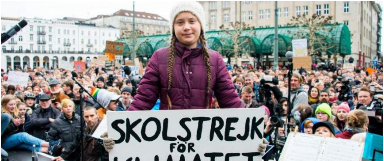
Ecce Greta Thunberg in urbe Hammaburgo manifestans: Dux motûs socialis, qui appellatur „ Fridays for Future “

Scribimus annum 2060; unus sum ex ultimis superstitibus Gretaniae , quae prius vocabatur Terra versicolor ( Buntland ).